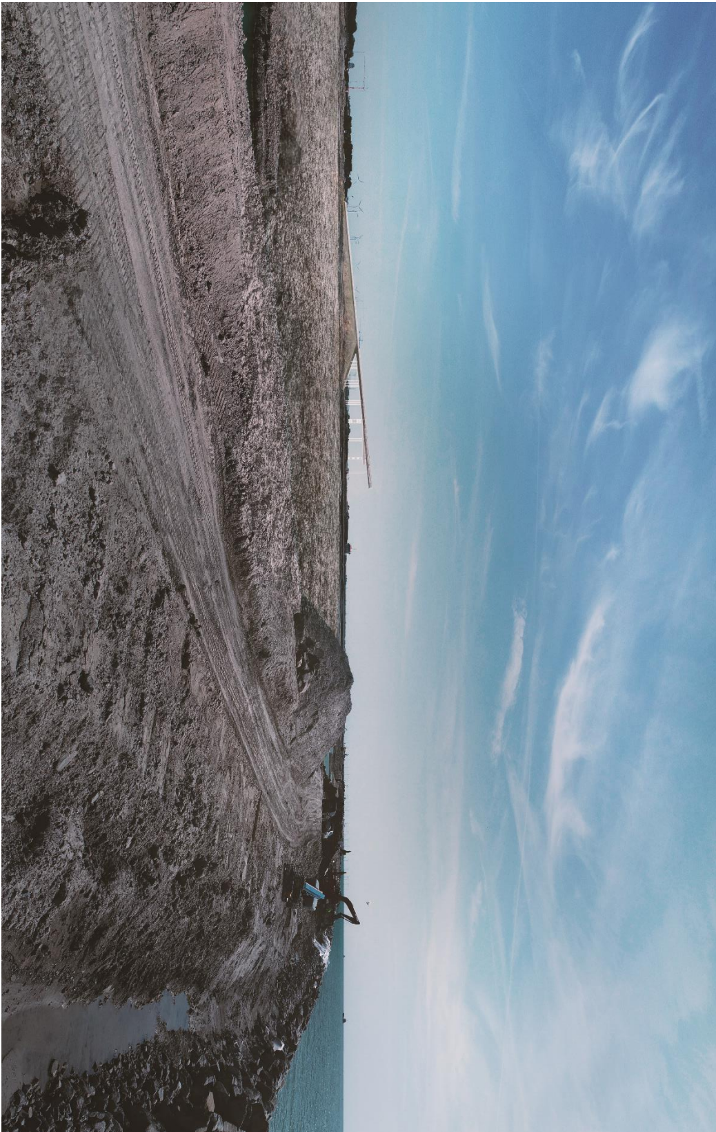
1.2 Fotostandpunkt 2 ved kystlinjen