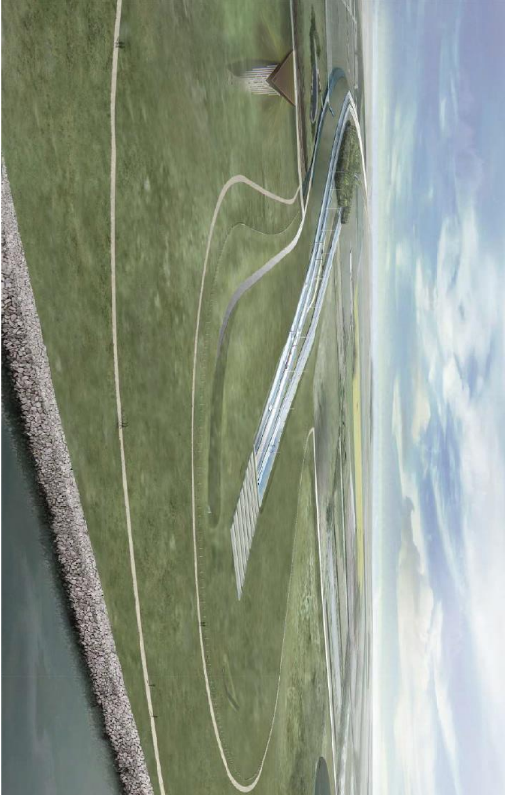
1.4 Fotostandpunkt 4 Pilen fra luften i retning mod nord