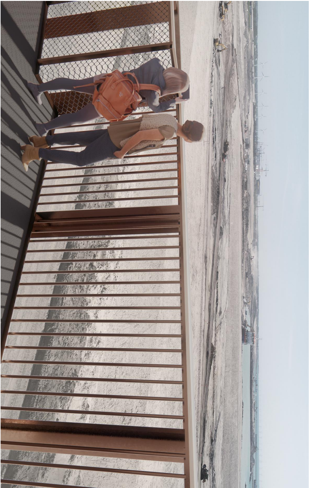
1.3 Fotostandpunkt 3 toppen af Pilen