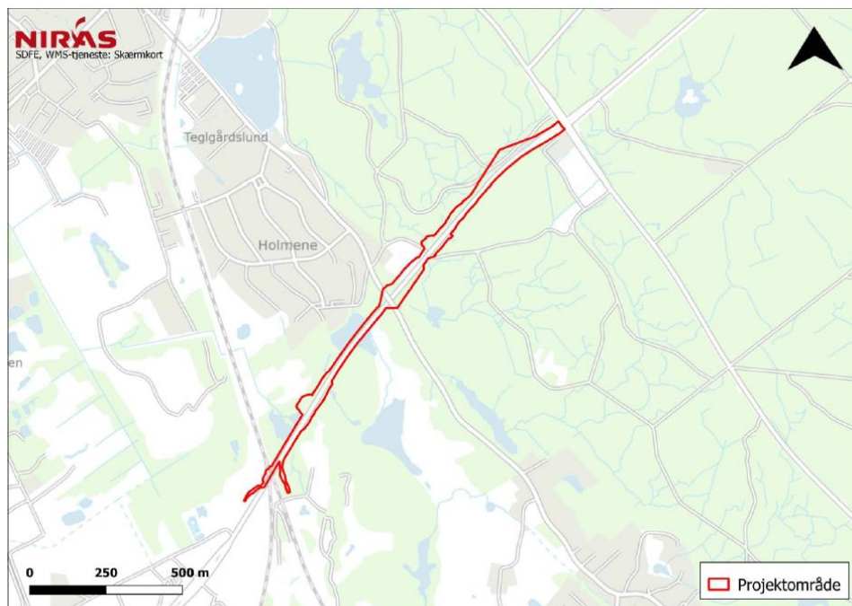
Figur 1.1: Oversigtsbillede over projektområdet for den nye cykelsti langs Overdrevsvejen.

via trug til afvanding. Den foreslåede cykelsti skal forbindes med cykelstierne ved Købehavnsvej i øst og ved den kommende stiforbindelse på tværs af Overdrevsvejen ved det kommende Favrholt Station i vest. Den nye cykelsti kommer således til at indgå i et sammenhængende cykelstinet.