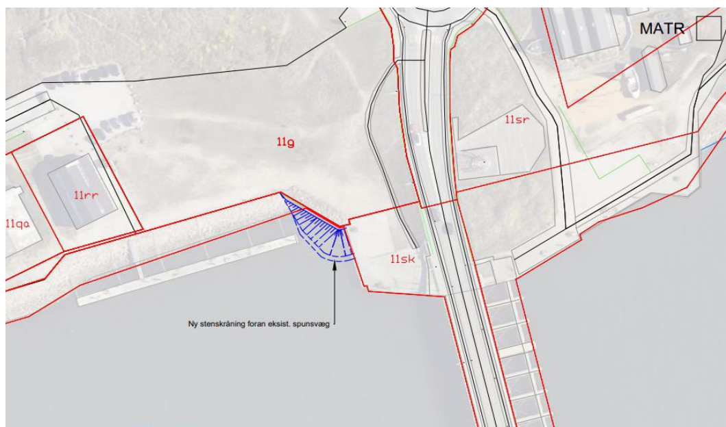
Figur 2. Illustration af fløjmur position

Hvide Sande Havn har den 12. oktober 2022 indgivet en samtykkeerklæring, hvor de bemyndiger byherre til at repræsentere havnen ifm. ansøgningen om opfyld på søterritoriet.