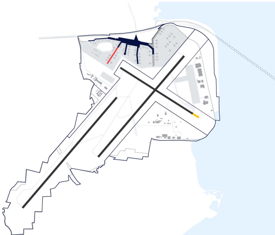
Figur 1: CPH's anbefalede udbygningsscenarie (nordlig udbygning med ny Finger A)