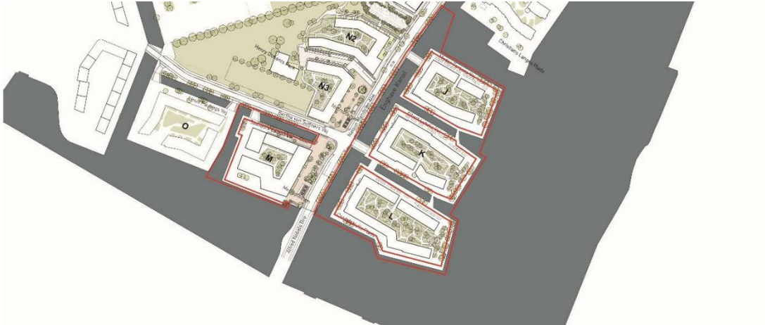
Figur 1. Samlet oversigt over de planlagte byggefelter ved Enghave Brygge med angivelse af det aktuelle projektområde (rød indramning).

Som en del af byggemodningen på Enghave Brygge skal HOFOR omlægge flere fjernvarmeledninger. Omlægningen placeres i kanalen mellem boligøerne K og L. Trafikstyrelsen er ikke myndighed for omlægning af fjernvarmeledningerne og styrelsens afgørelse vedrører derfor ikke disse.