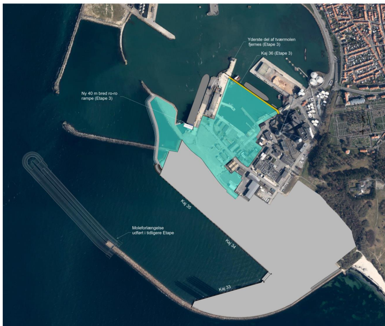
Figur 0.1 Arealudvidelserne og ny kaj i Etape 3 (blågrøn). Tidligere godkendte og gennemførte udvidelser (etape 1 og etape 2) vises med lys grå.

Udvidelsen af Etape 3 indebærer etablering af i alt ca. 10 ha nye oplagsarealer samt ca. 280 m kaj.