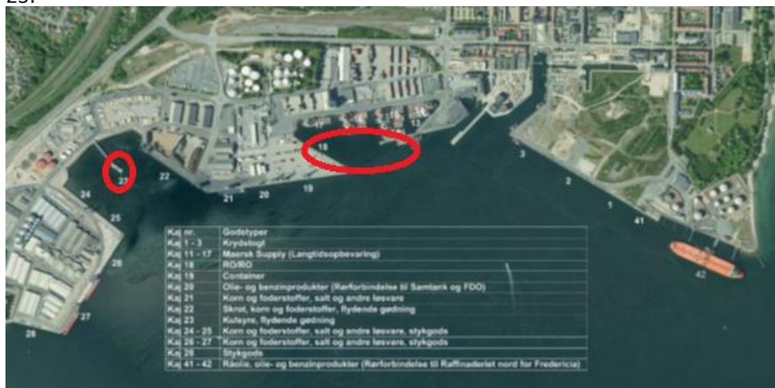
Figur 1: Nuværende havn i Fredericia