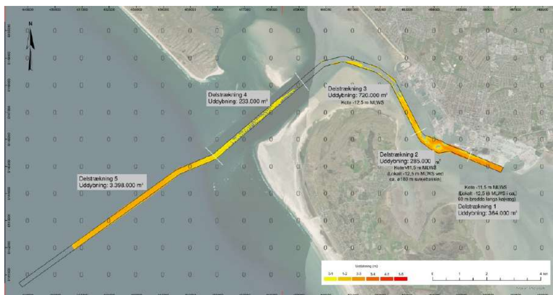
Figur 2: projektområder med delstrækninger og uddybningsmængder – OBS: uddybningsmængden for delstrækning 5 er ændret.

Trafikstyrelsen skal gøre opmærksom på at mængderne for delstrækning 5 er ændret til 2,1 mio. m 3 . Denne strækning er på Kystdirektoratets område.