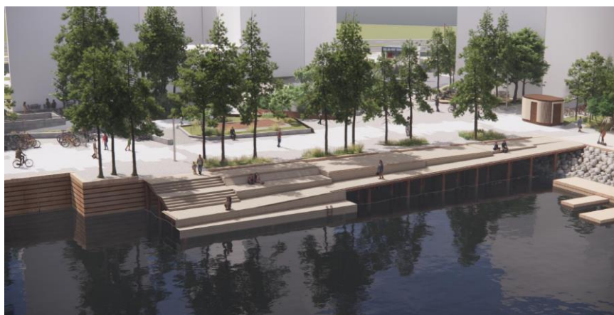
Figur 1: Visualisering af projektet

Derudover etableres der fem opholdsdæk udformet som indskudte bokse. Boksenes koter tilpasses til længdefaldet på Metropladsen. Der er således altid ét sted på hver boks, hvor der gives niveaufri adgang mellem boksen og Metropladsen (Figur 2).