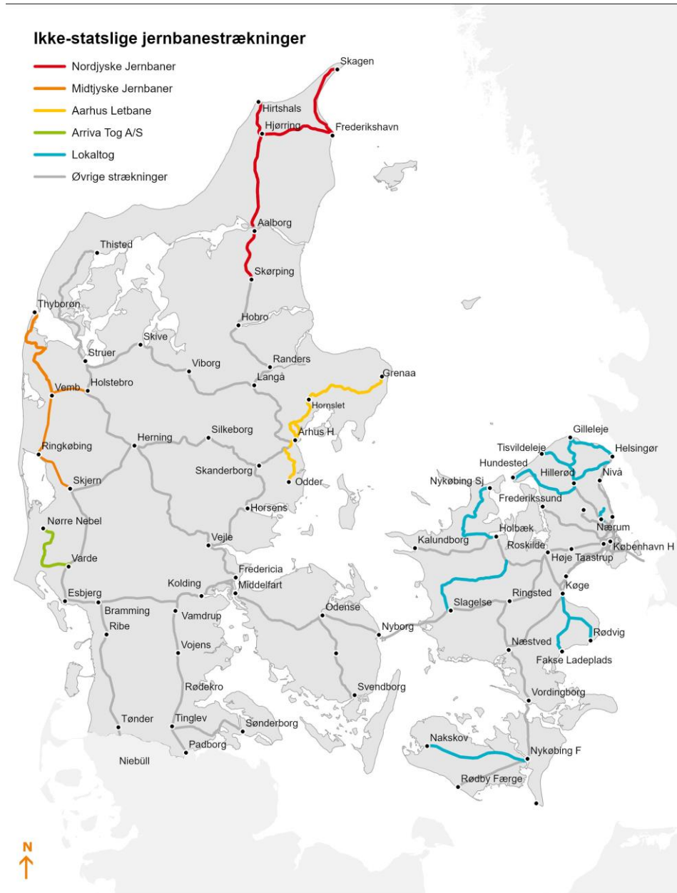
Figur 1. Togoperatører på ikke-statslige jernbanestrækninger, 2020