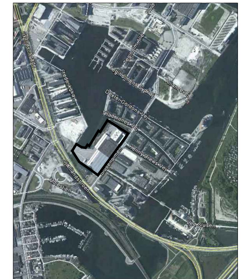
MHa 11.01.2019 Uddybning til -1,0 i Fordgraven