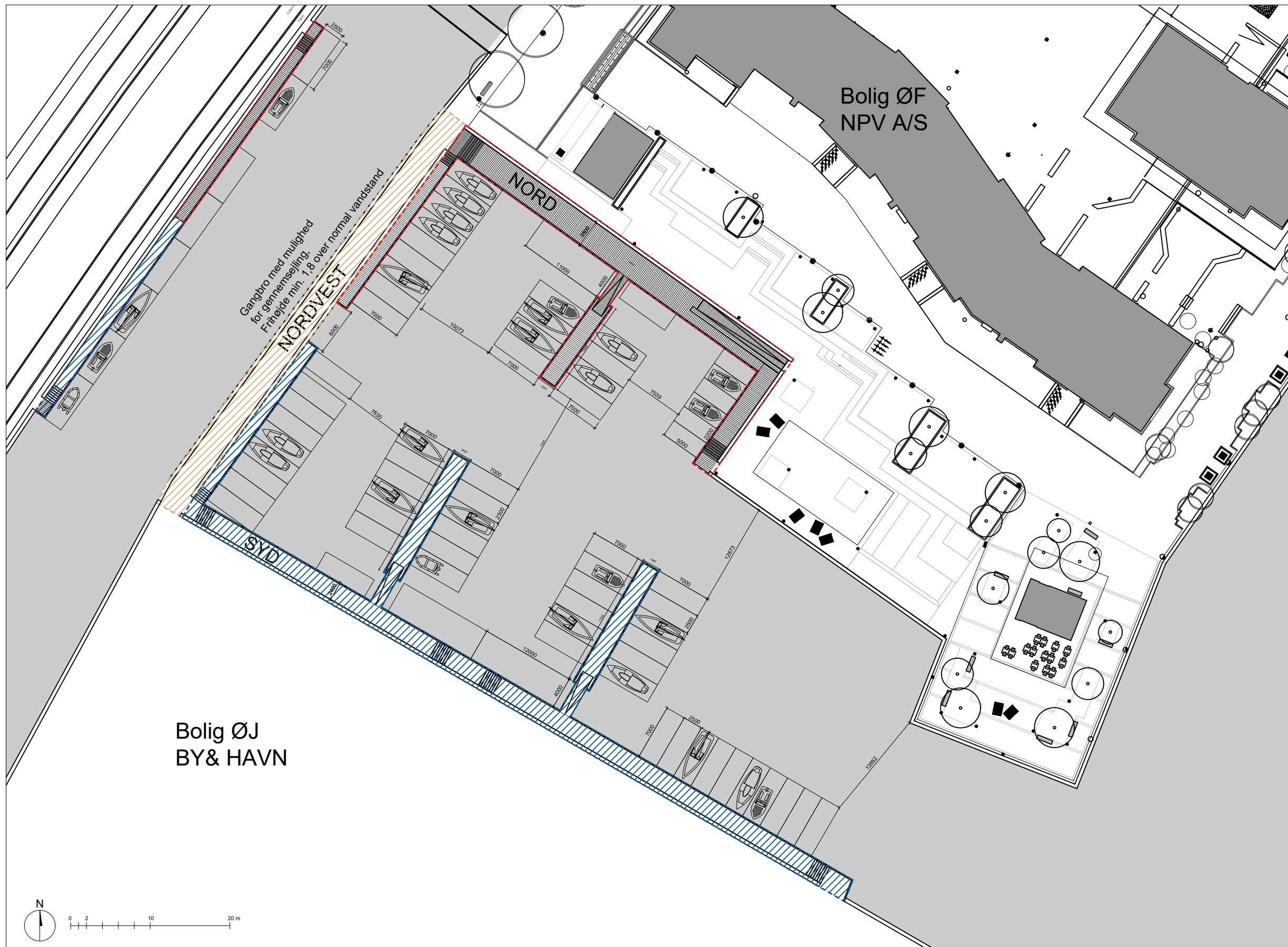
Enghave Brygge 1:5000