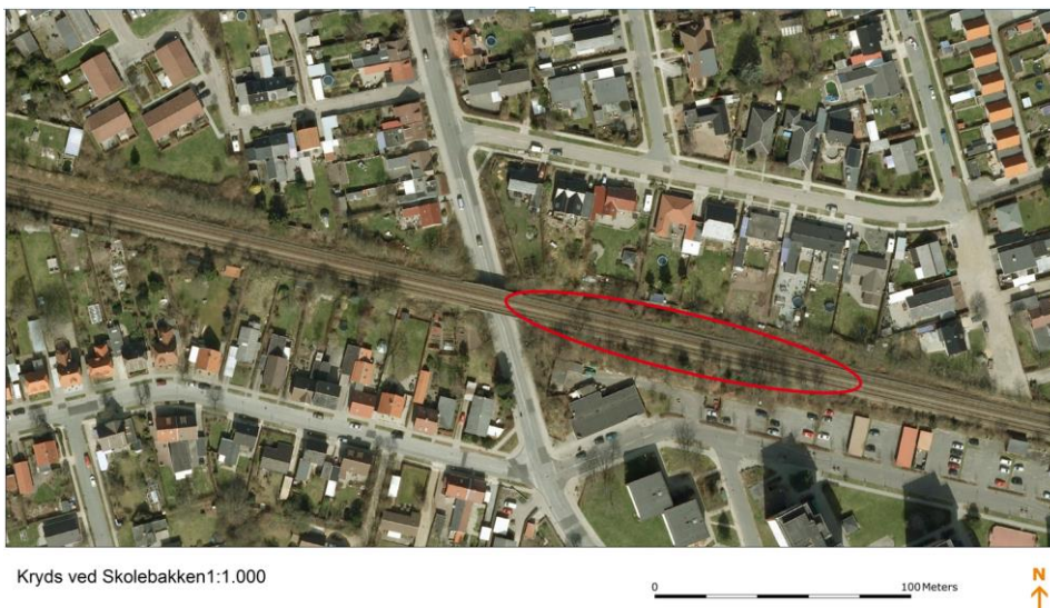
Figur 1: Eksempel på stationens placering ved Skolebakken

Jerne station kan placeres der, hvor jernbanen krydser Skolebakken. Stationen vil bestå af ca. 90 m lange perroner anlagt på Banedemarks areal på begge sider af jernbanen øst for Skolebakken. Der bliver adgang mellem perronerne via Skolebakken.